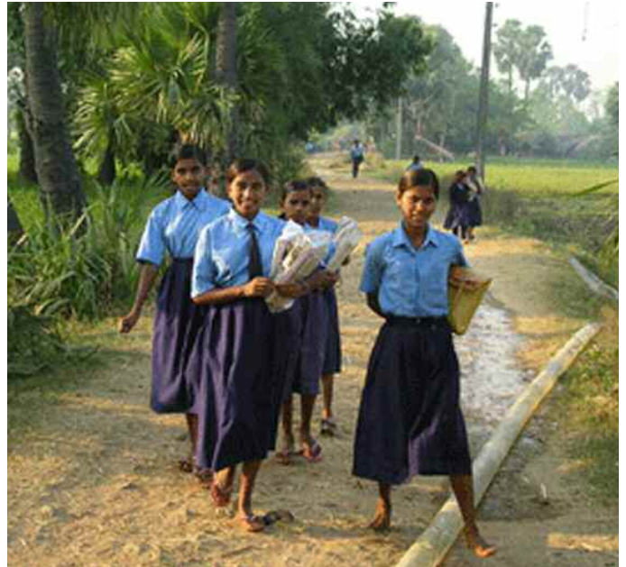
La campagna di Bodhgaya. Studentesse più grandi vanno a scuola a piedi con i loro preziosi libri avvolti in borse di plastica riciclate. Di solito, le ragazze abbandonano la scuola quando crescono per occuparsi dei lavori di casa e della famiglia. Tuttavia, questo fenomeno, nelle scuole del Progetto Alice, è molto minore rispetto a quello della scuola pubblica.